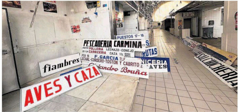
Visión general de los carteles de metacrilato en el Mercado de Abastos, ya cerrado.