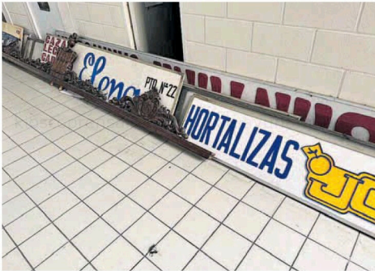
Algunos rótulos, amontonados en el suelo.