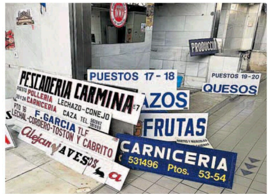
Ejemplos de los nombres de varios establecimientos del mercado. | Cedita